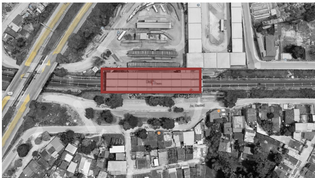
FIGURA 1 – ESTAÇÃO BARRO